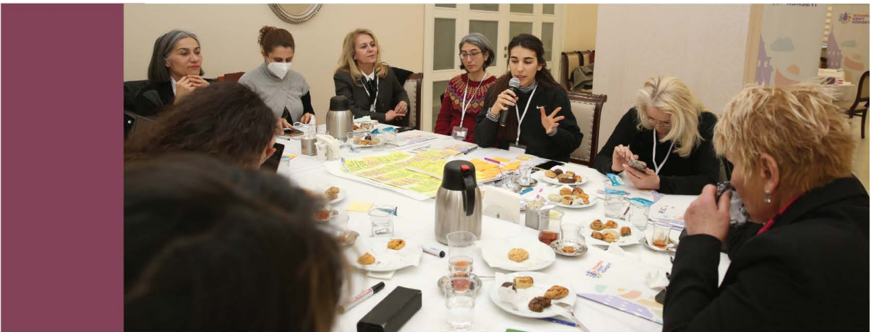
Görsel 2. Yoksulluk ve istihdam masası.

3. masaya geçildiğinde, önceki masalarda konuşulan sorunlar katılımcılara özetlenmiş, ekleme yapmak isteyip istemedikleri sorularak, konuların kapsayıcı olduğu bağımsız grup tarafından onaylanmıştır.