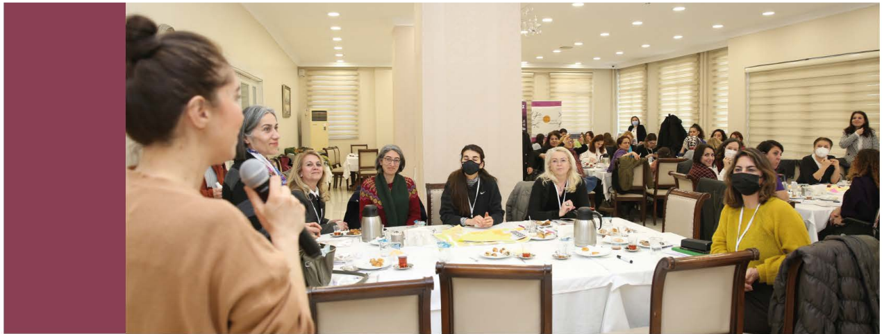
Görsel 3. Atölye

Son olarak eğitim odaklı çözümler bağlamında, kız çocuklarının okullaşma oranının artırılması gerektiği savunulmuş, teşvik politikalarının değiştirilmesi gerektiğine vurgu yapılmıştır. Toplumsal cinsiyet ve bu kapsamda eşitlik eğitimi dersinin tekrar eğitime konması gerektiği fikri paylaşılmıştır. En önemlisi, çocuğun çevre, toplumsal cinsiyet, sosyo- kültürel yapı, ekonomi vb. yukarıda değinilen her kategori bağlamında eğitilmesi gerektiği özellikle vurgulanmıştır.