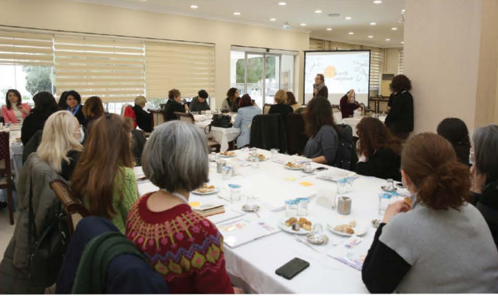
Görsel 4. Atölye

güvenliğine yönelik oluşturduğu tehdit ortaya konmuştur. Toplumsal yapı ve dinamiğin değişmesi de konuşulan konulardan biri olmuştur. Ülkedeki göç politikalarına bağlı olarak mahallelerde yaşanan sosyal uyumsuzluk ve kültürel gerilim sorunlarının da mahallelerdeki kadın güvensizliğini arttırdığına yönelik bir kanı oluşturduğu ortaya çıkmıştır. Bunun yanı sıra, mahalle kültürünün ve mahalle içindeki tanışıklıkların güvende olma deneyimine olumlu katkı sağladığı konuşulmuştur. Ek olarak, mahalle ortamında “kadının korunması gerektiği” bakış açısına sahip erkek bireylerin de taciz suçu işleyebildiği vurgulanmıştır. Bu noktada, sosyal çalışmacıların, kadın hakları savunucularının, güvensizlik ve şiddet konusunda uzman meslek elemanlarının işbirliği yapmasının önemi vurgulanmıştır. “Mor Otobüs” örneğinde olduğu gibi, kadınlara merkezden en uzak köşede bile ulaşmayı hedefleyen, onlara mahalle içlerinde yapılan bilgilendirme ve farkındalık çalışmalarının faydaları ortaya konmuştur.