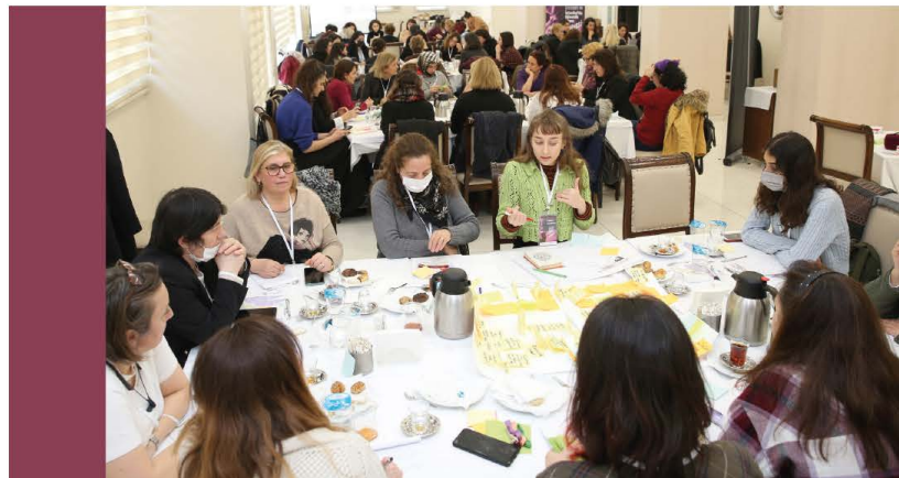
Görsel 6. Dayanışma masası.

Öneri 18: Sığınma evlerinde kalınan süre boyunca sığınan bireye istihdam sağlanması için yönlendirme yapılması. Kadın istihdamını desteklemek amacıyla küçük atölyeler, kooperatifler arasında ağlar oluşturulması. İstihdam sağlandıktan sonra mümkün olduğunca sigorta takibinin yetkililer tarafından yapılması oldukça önem arz etmektedir, çünkü; işe ihtiyacı olan kadınların sigortasız çalıştırılması çok yaygın görülen bir durumdur.