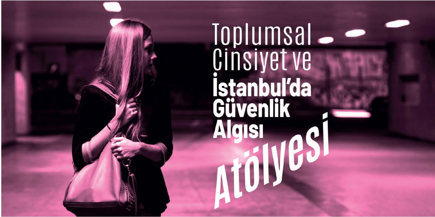
Görsel 1. Sosyal medya hesaplarında paylaşılan çağrı görseli.

Futurewell araştırma grubu , Türkiye'de henüz keşfedilmemiş tasarım, hizmet ve teknoloji alanlarında eleştirel düşünce ve yapı oluşturmayı hedeflemektedir. Mevcut çalışmalar; erişim ve yaşlanma, gelecekte topluluklar ve onların yaratıcı potansiyelleri ve sürdürülebilirlikleri (iş, eğitim, yemek, güzellik, ritüeller) hakkında 'onaran keşifler' içermektedir. Gelecekteki hallerimizi hayal etmek için çok disiplinli yöntemler geliştiren, paylaşan ve uygulayan Futurewell, ortağı olduğu Güvenliği Nakşetmek projesi ile teknolojide tasarım adaleti ve kadın güvenliği düşüncelerini merkeze alarak hem sosyal odaklı hem de akıllı teknolojileri kullanan bir yorgan işleme çalışması yürütmektedir.