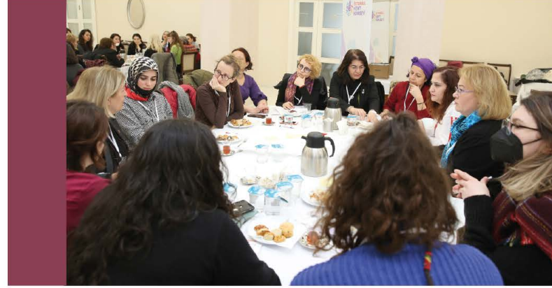
Görsel 7. Şiddet, hak ihlalleri ve ayrımcılık masası.

Ayrıca, kadınların temel ihtiyaçlarından biri olan hijyenik pedlerin ücretsiz olması konusunda aktarımlarda bulunulmuştur. İstanbul'da kadınların sağlığa erişiminde ciddi sorunların var olduğu gözlemlenmiştir. Engelli kadınların kişisel sağlık haklarına erişim konusunda yaşadıkları sıkıntılar da paylaşılmıştır.